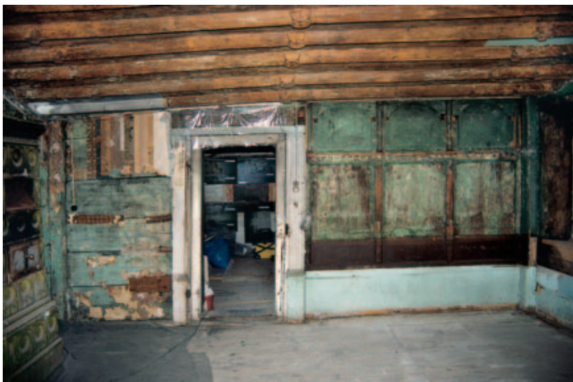
2 Eingangsbereich der Stube im Vorzustand. Rechts von der Tür der Täfer.