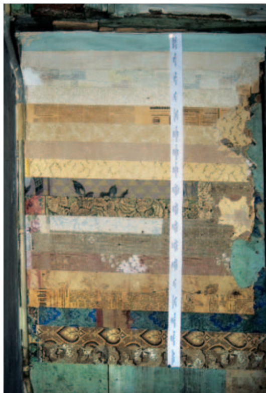
6 Tapetenabtrepung mit Datierung.

„Friedrichshafen 25. März: Die ersten Fahrversuche mit einem Zeppelinischen Luftfahrzeug sollen im Juni des Jahres stattfinden“.