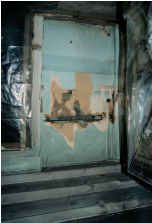
4 Wandbereich links neben der Tür mit Tapetenbeklebungen vor der Freilegung und Sondierung.