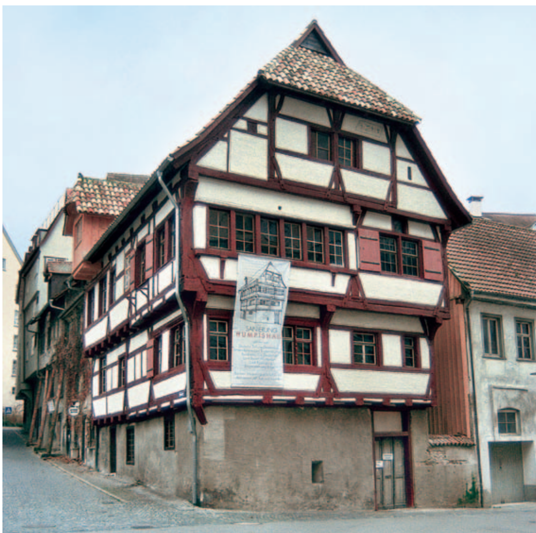
1 Das „Humpishaus“ in der Humpisstraße 5, Gesamtansicht.

Im 1. Obergeschoss, das ursprünglich vorwiegend Lagerzwecken diente, befanden sich hofseitig in ganzer Hauslänge ein großer Flur und straßenseitig drei durch Spundwände abgetrennte Stuben bzw. Kammern. Am Türsturz des Eingangs zur südwestlichen Kammer ist noch ein schönes gotisches Eselsrückenprofil erhalten. Der Lehm Schlag auf den Spundwänden stammt dagegen aus einer späteren Umbauphase, vermutlich von 1569. Danach wurden alle Wandflächen verputzt und das Holzwerk schwarz gestrichen. Auf den Gefachflächen sind zugehörige schwarze Begleitbänder und gemalte schwarze Viertelrundungen in den Ecken als Verzierung zu finden. In der nordöstlichen Stube dieses Geschosses wurden die Holztäfer an Wänden und Decke erst 2001 bei Untersuchungen aufgedeckt. Sie gehören vermutlich zu einer Umbauphase des 18. Jahrhunderts und zeigen eine eigenwillige Farbfassung. Die Decke und die oberen Wandteile bis zu den Fensterstürzen sind hellgrün, der Rest der Wand-