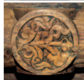
12–15 Geschnittene Mittelrosetten nach der Freilegung.