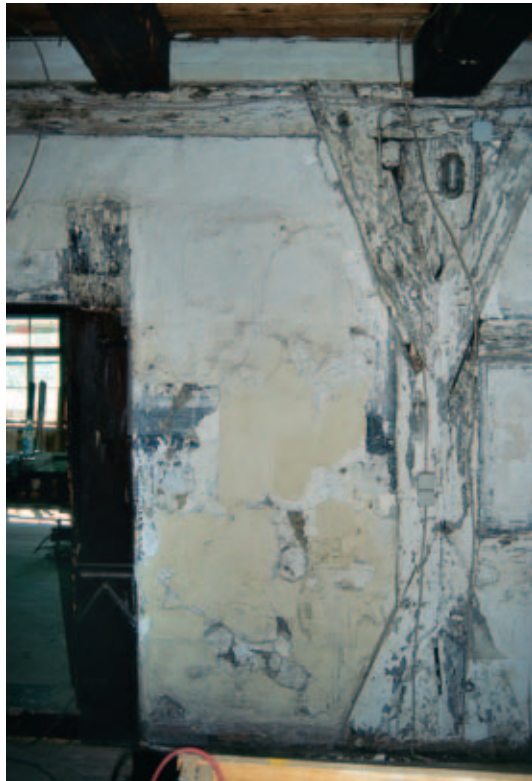
19 Flur, Außenwand der Bohlenstube rechts der Tür: Lehmwand mit Scheinfachwerk während der Freilegung und Sicherung.