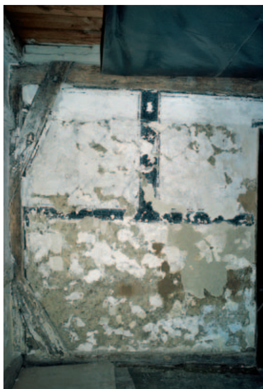
16 Flur, Außenwand der Bohlenstube links der Tür. Lehmwand mit Scheinfachwerk im Vorzustand.